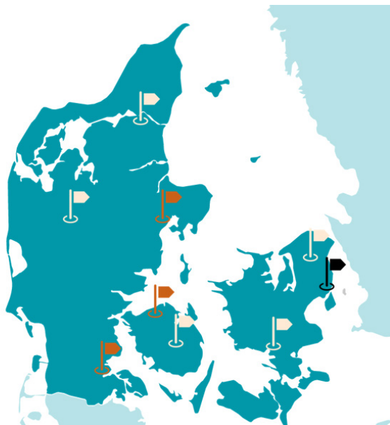
Figur 1: I 2023 afholdte VE-rejseholdet 5 vidensdage (hvide flag), 3 workshops (røde flag) og 1 webinar (sort flag).

ressortområder og giver VE-rejseholdet mulighed for løbende ajourføring om eksempelvis klagenævnsspraksis.