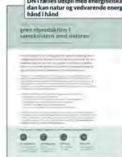
Principaften 19. juni 2022: "Grøn afveksling i samarbejde med naturen"